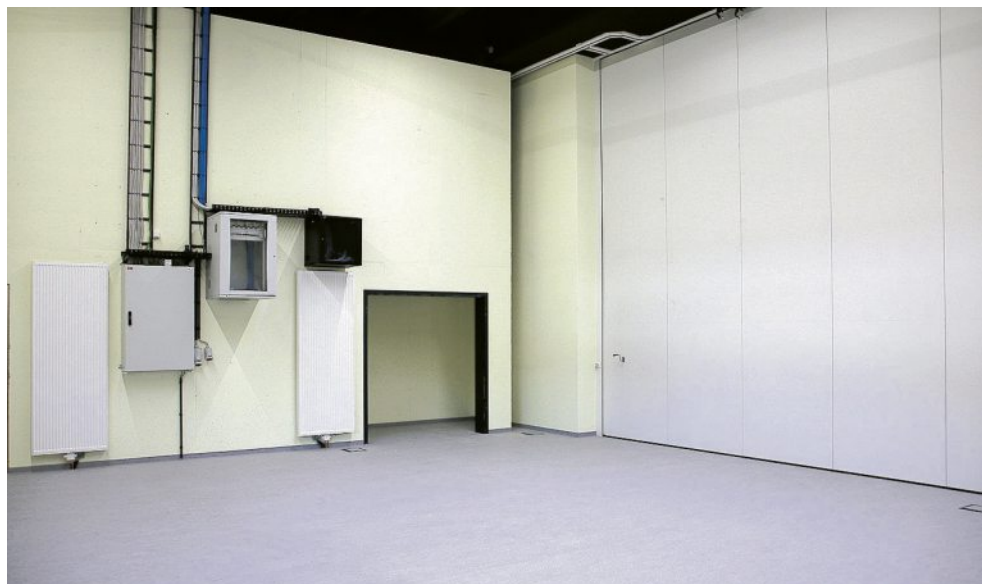
Der Multifunktionsraum dient der Halle als Bühne, kann aber auch separater Sportraum genutzt werden. Mit einer mobile Trennwand sind beide Räume unabhängig voneinander nutzbar.