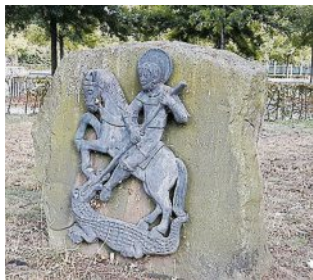
Der heilige Georg zieht um.