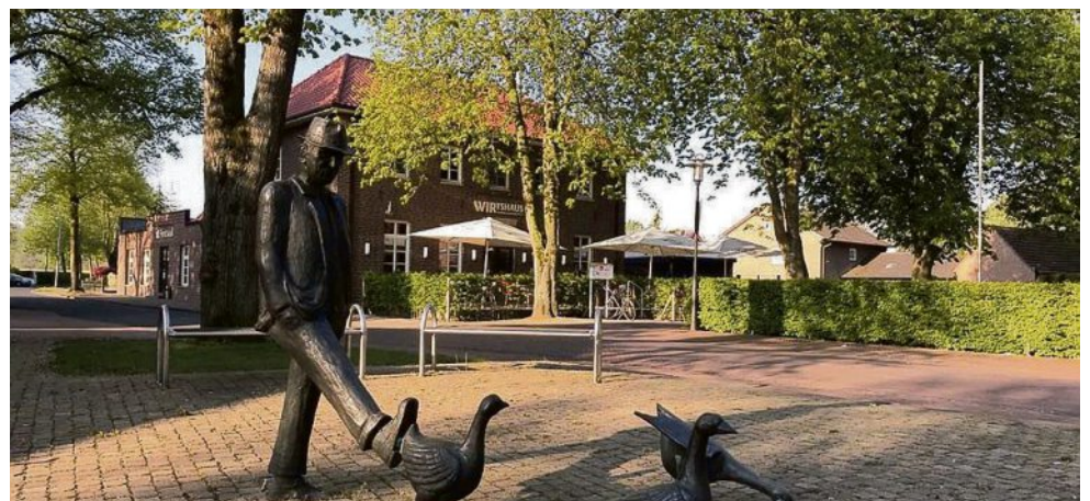
Am Gänsemarkt in Ellewick, wo sich das Bild des Gänsetreibers befindet, startet die „Gaasepatt-Route“ mit vielen historischen Infos.

de Aufgabe in der nächsten Zeit. So kann man die lokale Geschichte und die vielen kleinen Geschichten lebendig für die Nachwelt erhalten. Die „Gaasepatt-Route“ ist ein Schatz für Wander- und Geschichtsbegeisterte. Sie führt Besucher auf eine faszinierende Entdeckungsreise durch die Vergangenheit der Gemeinde. Der Rundweg bietet eine einzigartige Gelegenheit, die Geschichte und Kultur der Region hautnah zu erleben. Die „Gaasepatt-Route“ wird nicht nur Besucher aus der Umgebung anziehen, sondern auch den Dorfbewohnern die Möglichkeit geben, die Geschichte und die Schönheit der Heimat neu zu entdecken oder einfach in der Natur zu entspannen. Am Ortseingang von Ellewick wurde dazu auch ein kleiner barrierefreier Rastplatz hergerichtet.