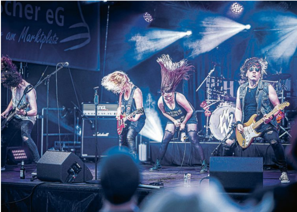
„Why Amnesia“ aus Recklinghausen waren schon im letzten Jahr bei Rock im Garten in Gescher dabei. In diesem rocken die Recklinghäuser erneut in der Glockenstadt.