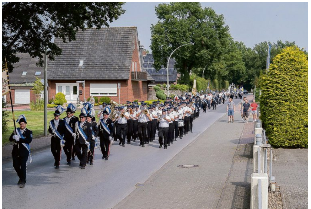
Einige Male werden die Wessendorfer Schützen an den Festtagen antreten und sich zu Umzügen formieren.