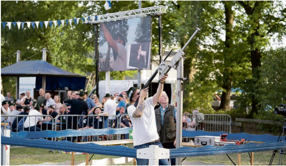
Damit man sehen kann, wer gerade beim Schießen an der Reihe ist, wird ein Livebild auf die Großbildleinwand übertragen.