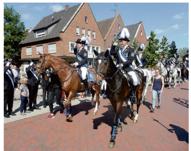
Die Offiziere hoch zu Ross sind auch immer ein Blickfang bei der Königsparade.