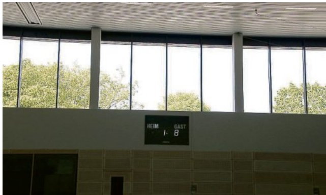
Große Fenster sorgen für viel Tageslicht in der neuen Halle.

Die Sporthalle an der Kreuzschule in Heek ist in den vergangenen Monaten fit für die Zukunft gemacht worden. Nun steht der erste offizielle Termin in der neuen Halle an.