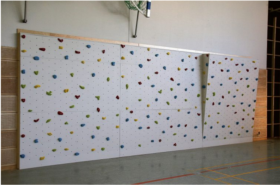
Ein Highlight in der modernisierten Sporthalle an der Heeker Kreuzschule ist die großflächige Kletterwand, die an einer Stirnwand montiert wurde.