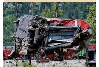
Bei dem Zugunglück starben fünf Menschen.

GARMISCH-PARTENKIRCHEN Beschädigte Betonschwellen waren nach derzeitigem Ermittlungsstand die Hauptursache für das tödliche Zugunglück von Garmisch-Partenkirchen. Zu diesem Ergebnis kommt ein Zwischenbericht der Bundesstelle für Eisenbahnunfalluntersuchung (BEU), der am Donnerstag veröffentlicht wurde. Als am 3. Juni vergangenen Jahres ein Regionalzug nach München entgleiste, starben fünf Menschen, 78 wurden verletzt, 16 von ihnen schwer. In dem Zwischenbericht benennen die Unfallermittler einen „Mangel am Oberbau“ der Bahnstrecke als primäre Ursache für das Entgleisen des Regionalzugs. Die am Unglücksort verlegten Spannbetonschwellen hätten Schäden aufgewiesen, die dazu geführt hätten, dass die sogenannten Schienenauflager als Bindeglieder zwischen Schiene und Beton wegbrachen. „Das ist das, was derzeit gesichert ist“, sagte ein BEU-Sprecher am Donnerstag. „Die Ermittlungen zur Unfallursache sind aber deutlich umfangreicher und dauern an.“ dpa