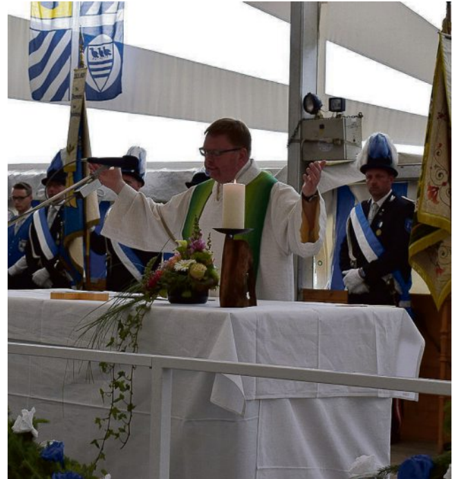
Die heilige Messe im Festzelt ist der Auftakt in den Schützenfestfreitag, an dem auch eine neuer König ermittelt wird.

Wir wünschen dem Schützenverein Wessendorf St. Liudger ein schönes Fest und ein spannendes Vogelschießen.