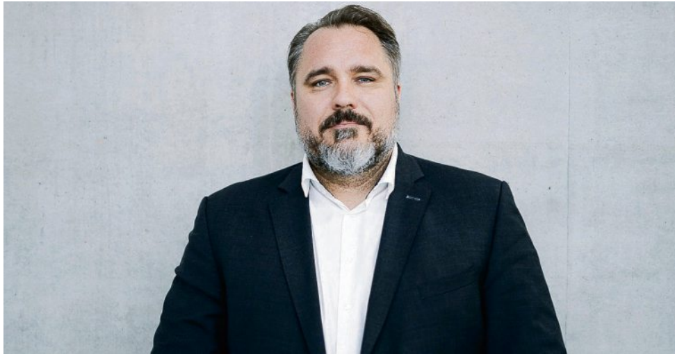
Daniel Föst, bau- und wohnungspolitischer Sprecher der FDP, sieht trotz Annäherungen noch viel Arbeit bei der Kompromissfindung beim Heizungsgesetz.

Durch die Mindestloohnerhöhung im vergangenen Oktober haben in Nordrhein-Westfalen 1,3 Millionen Menschen mehr Geld in der Tasche. Das seien 16 Prozent der Beschäftigten im Land, teilte das Statistische Landesamt am Donnerstag mit. Profitiert haben vor allem Beschäftigte in nicht-tarifgebundenen Betrieben. Sie machten 71 Prozent der Mindestlohnempfänger aus. 54 Prozent der Menschen, die Mindestlohn bekamen, waren geringfügig beschäftigt. Auch profitierten vor allem Frauen mit Anteil von 57 Prozent von der höheren Lohnuntergrenze. Der Mindestlohn, der Beschäftigten gezahlt werden muss, war im Oktober 2022 auf 12 Euro pro Stunde angehoben worden. dpa