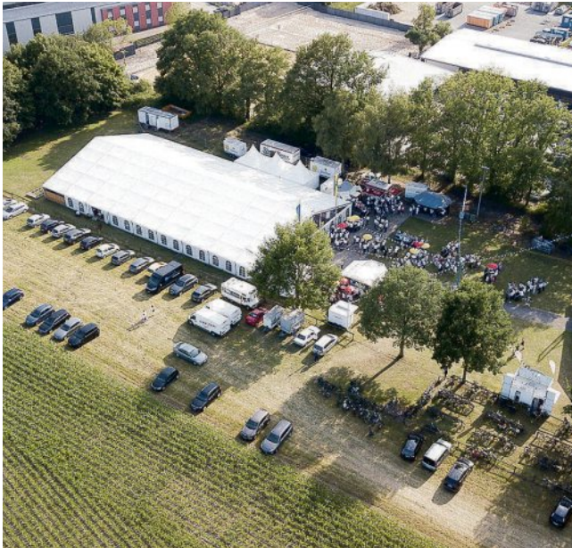
Der Festplatz aus der Vogelperspektive: Hier spielt sich in den vier Schützenfesttagen das meiste Programm ab.